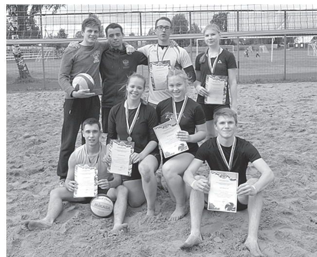
Победители и призёры первенства.

10 августа в посёлке Майский состоялось спортивно-массовое мероприятие, посвящённое Дню физкультурника. Несмотря на пасмурную погоду, на стадион вышло более 200 человек. Спортивное утро началось с общей зарядки. Одним из самых увлекательных соревнований получилось открытое первенство Вологодского района по пляжному волейболу в номинации «Микст». Участие в турнире приняли семь пар, в составе которых, кроме местных, играли «пляжники» из Вологды и Кириллова.