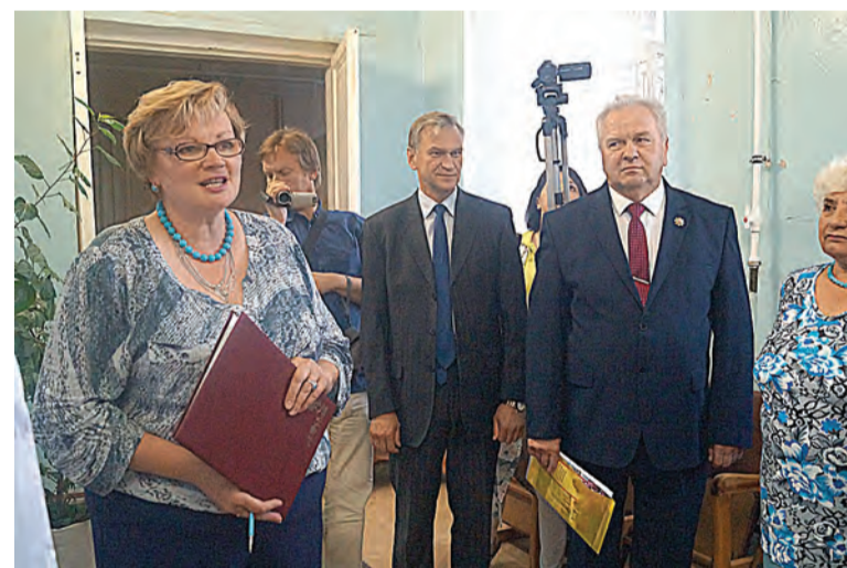
Открытие музея Истории Устюженской больницы

кабинетами (рентгеновским, флюорографическим, физиотерапевтическим, УЗИ, эндоскопическим), акушерским и