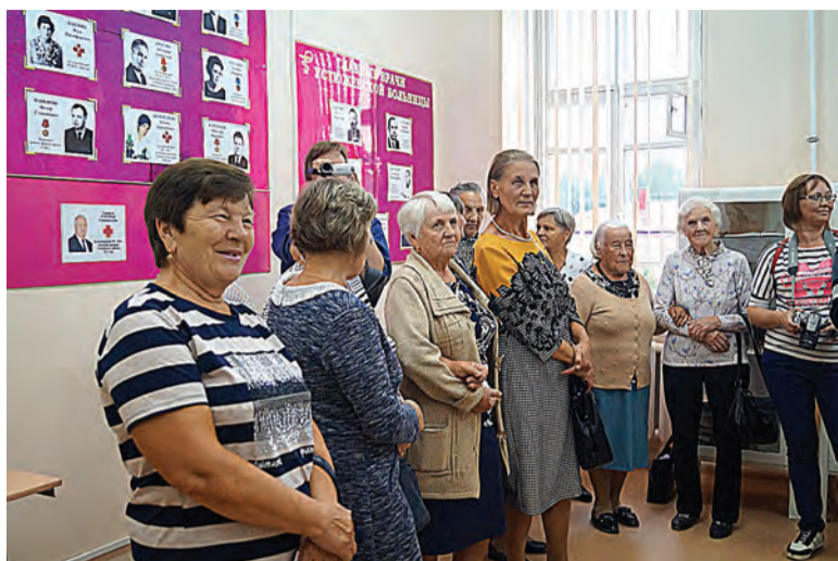
Открытие музея - первые гости ветераны здравоохранения

Приобретено медицинское оборудование: аппарат УЗИ высокого класса, иммуноферментный комплекс, рентгенодиагностический комплекс, аппарат наркозно-дыхательный, аппарат