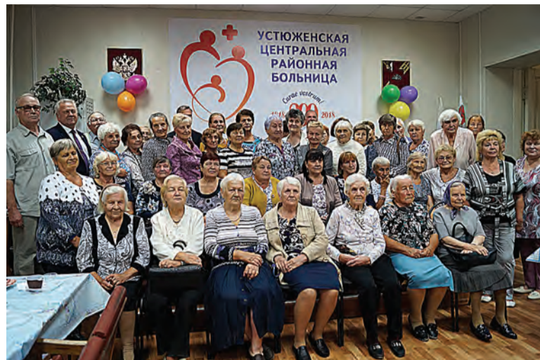
Ветераны здравоохранения Устюженского района

В октябре 1941 года в городе были развернуты 2 эвакогоспиталя. Они проработали здесь до начала января 1942 года. В селе Михайловское, недалеко от города, был организован Дом отдыха для восстановления сил летчиков 1-го гвардейского минно-торпедного